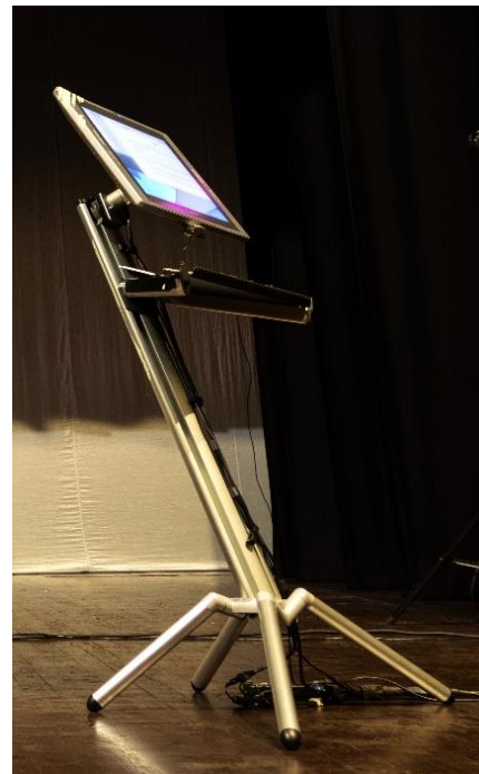
An dieser Staffelei mit Monitor wird auf der Bühne live gemalt